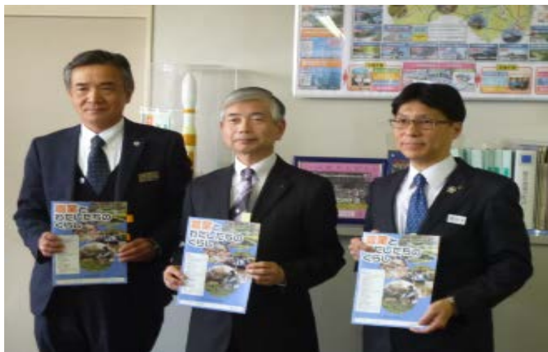
写真：教材本贈呈式の様子