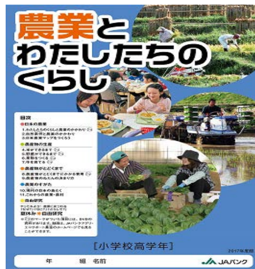
写真：贈呈した教材本