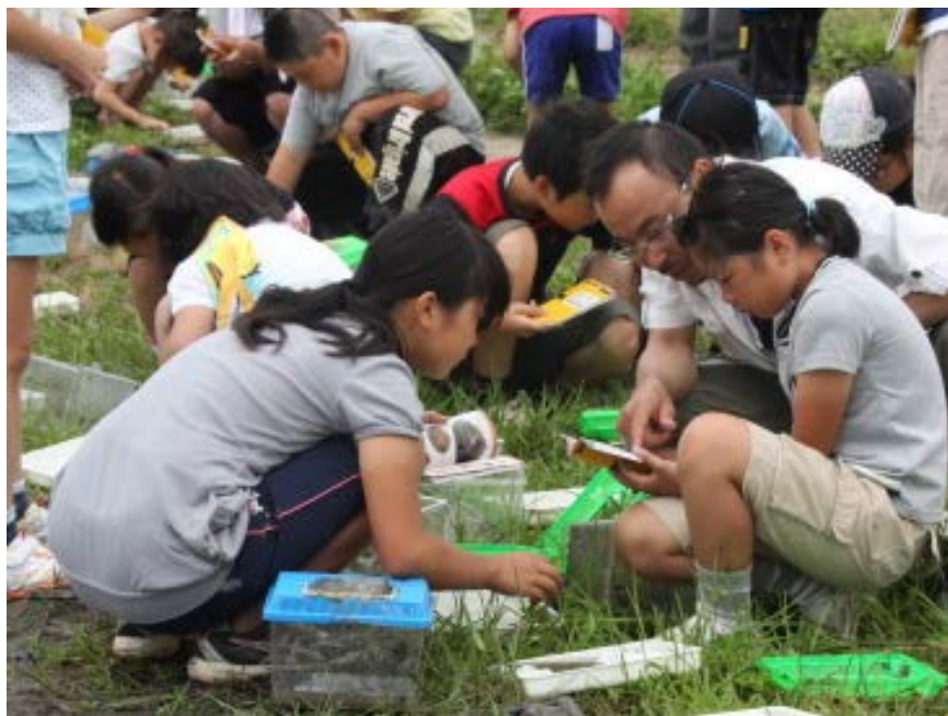
JA福島さくら 田んぼの生き物調査